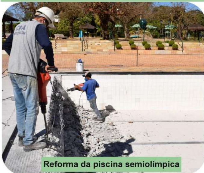
Reforma da piscina semiolímpica