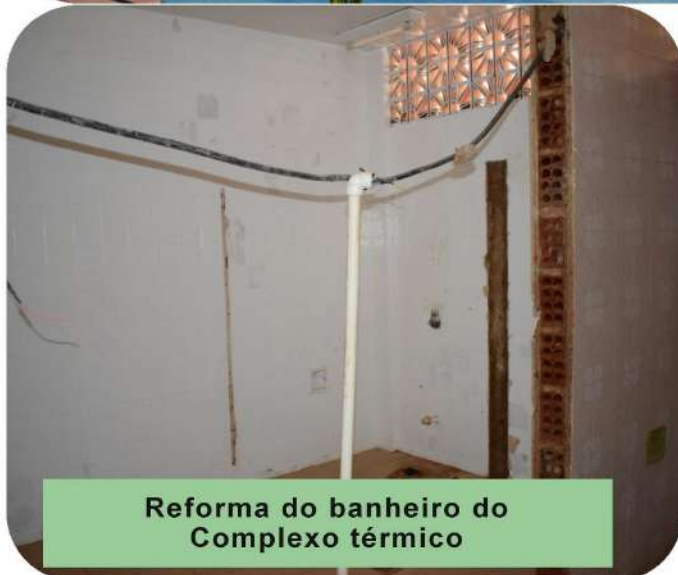
Reforma do banheiro do Complexo térmico