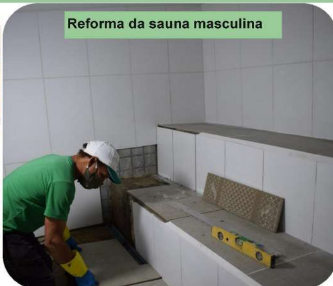
Reforma da sauna masculina