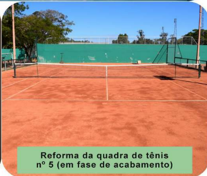
Reforma da quadra de tênis nº 5 (em fase de acabamento)