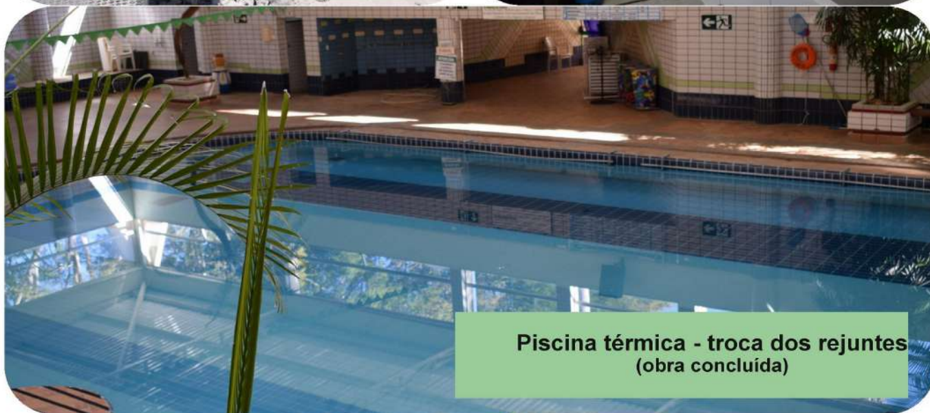
Piscina térmica - troca dos rejuntas (obra concluída)