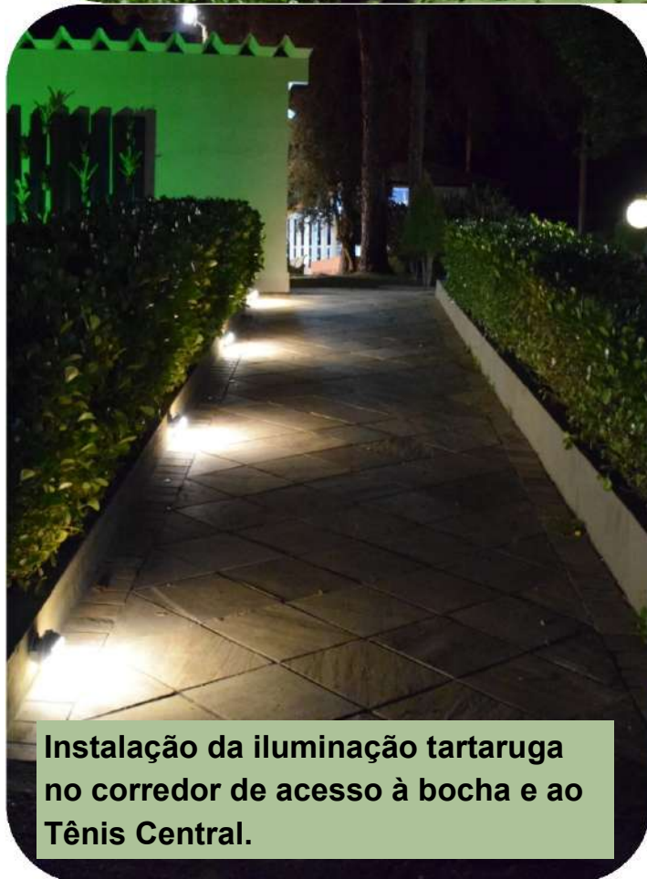
Instalação da iluminação tartaruga no corredor de acesso à bocha e ao Tênis Central.