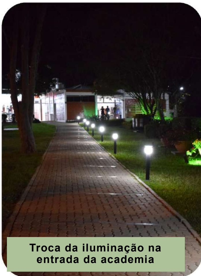
Troca da iluminação na entrada da academia