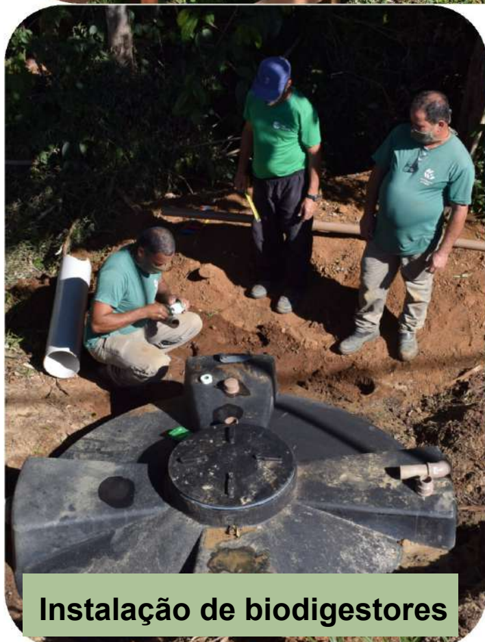
Instalação de biodigestores