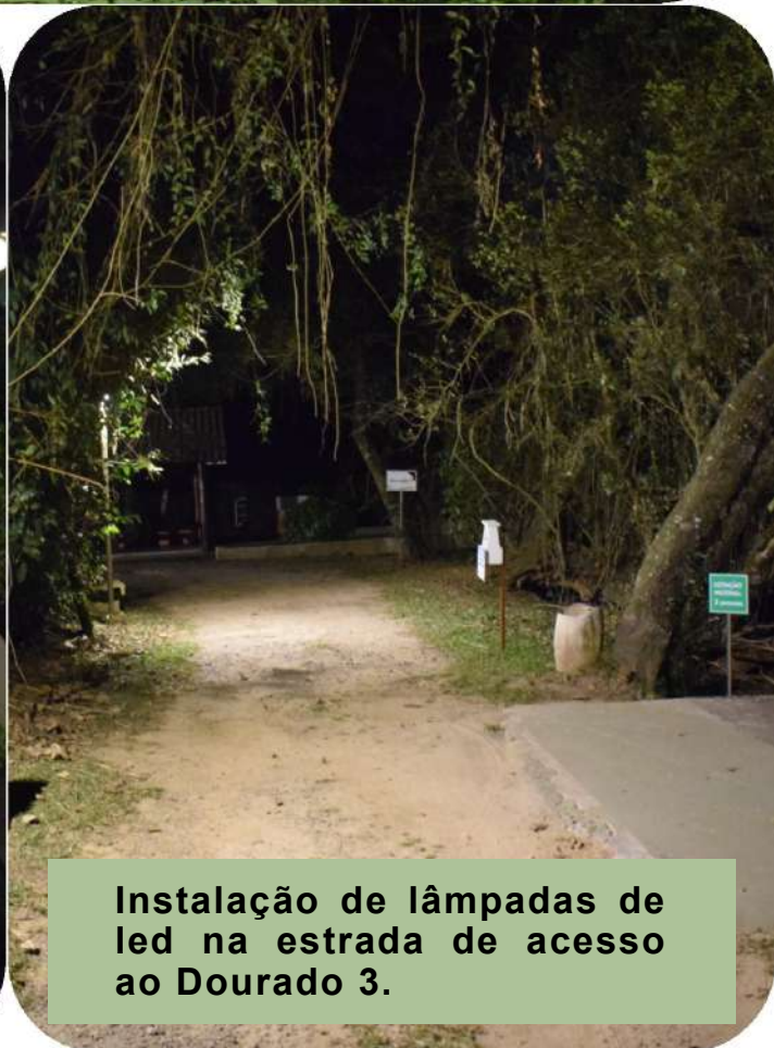
Instalação de lâmpadas de led na estrada de acesso ao Dourado 3.