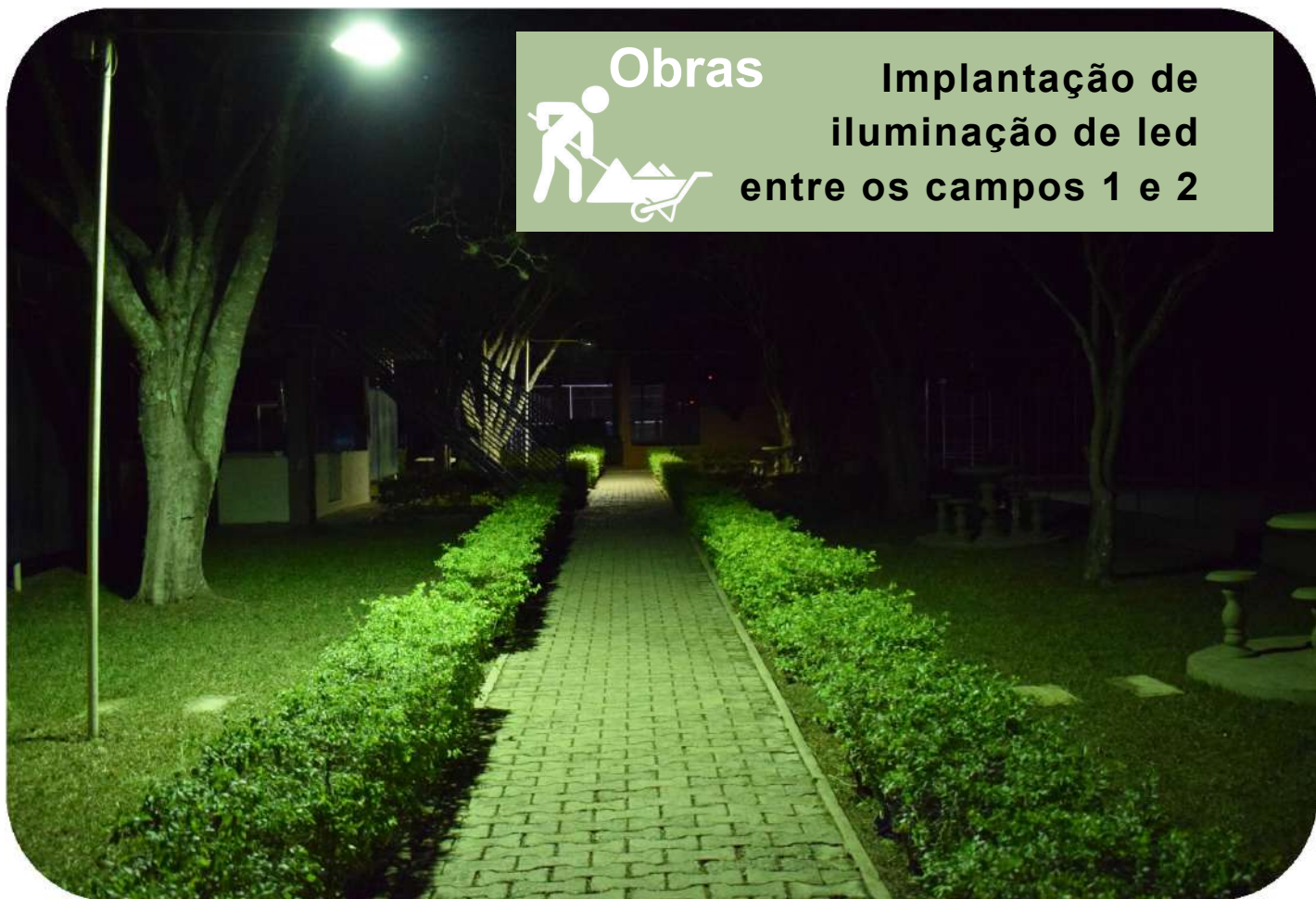
Obras Implantação de iluminação de led entre os campos 1 e 2