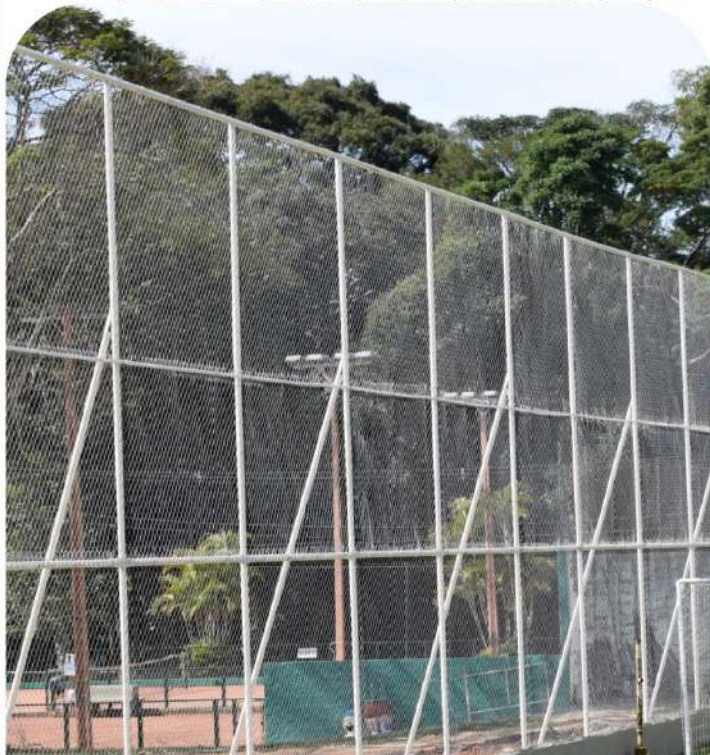
Instalação de novo alambrado no campo 1

Podas de árvores, corte de grama, manutenção diária dos campos, paisagismo e limpeza das vias em geral.