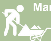
Manutenção Troca de luminárias por lâmpadas de led no corredor da sede