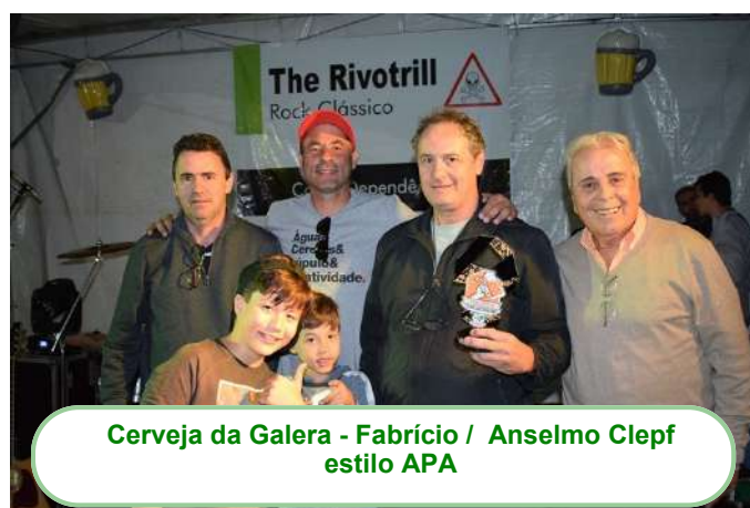
Cerveja da Galera - Fabrício / Anselmo Clept estilo APA