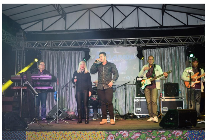
Banda Palladium tocou nos dois dias da Festa