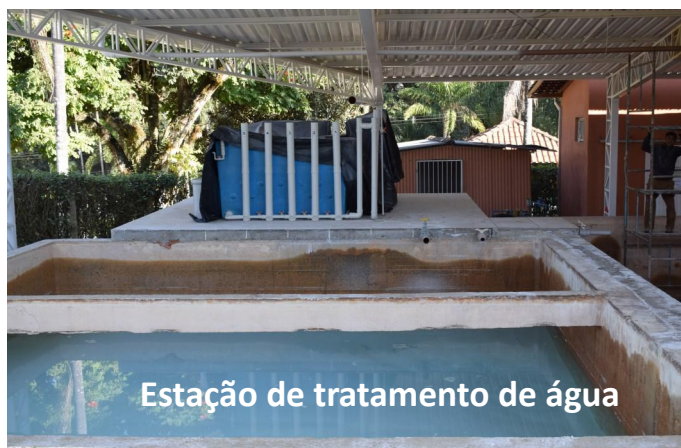
Estação de tratamento de água