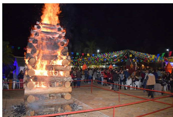
Fogueira de quatro metros de altura