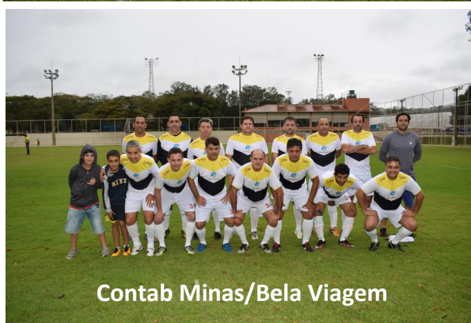
Contab Minas/Bela Viagem