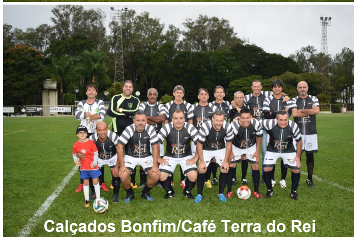
Calçados Bonfim/Café Terra do Rei