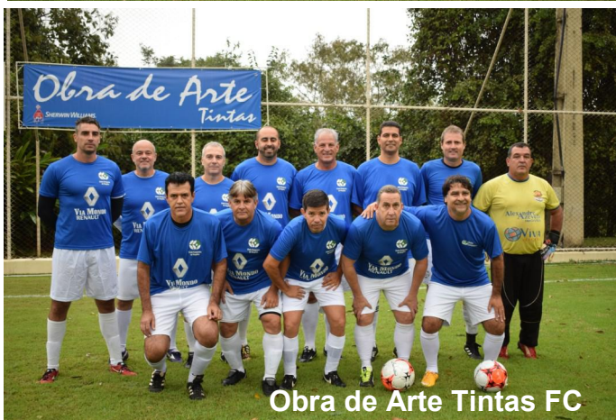
Obra de Arte Tintas FC