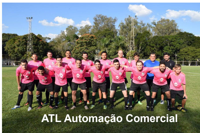
ATL Automação Comercial