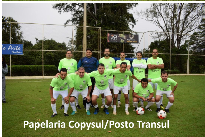
Papellaria Copysul/Posto Transul